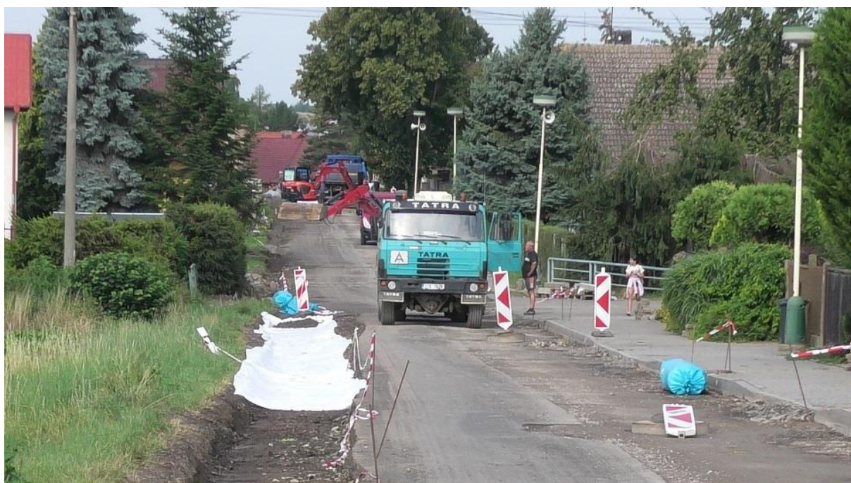
17.8.2023 oprava silnice po kanalizaci od Nabočan

Celé dílo bez realizace v I/17 stálo obec 97 125 020,95,- Kč bez DPH včetně všech dodatků. Dotaci ze Státního fondu životního prostředí jsme vyčerpali ve výši 47 318 951,00 Kč, dvě dotace z krajského úřadu pro Pardubický kraj jsme vyčerpali v celkové výši 6,6 mil Kč. Na zbývajících 43 206 069 Kč jsme čerpali úvěr z Komerční banky, kde má obec tento úvěr splatný na 25 let, s 15-ti letou fixací úroku 1,97% do roku 2038. Splátka úvěru včetně úroků bude stát obecní rozpočet 2,860 mil. Kč ročně. O nadcházejícím rozpočtu na rok 2024 ale budu informovat dále.