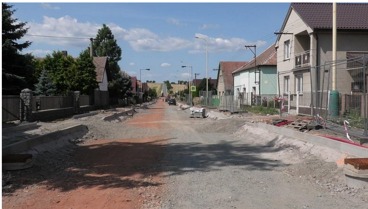
6.7.2023 NK hlavní silnice

Uložení kanalizace do I/17 včetně vybudování přípojek stálo obec 5,309 mil. Kč bez DPH. Poplatek za uložení inženýrské sítě do silnice I. třídy ve prospěch ŘSD ČR vyšlo obecní kasu na 3,500 mil. Kč. Požádali jsme o dotaci z Krajského úřadu pro Pardubický kraj, a tu jsme obdrželi ve výši 2,950 mil Kč.